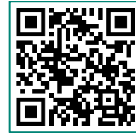
Hier geht's direkt zur Website von beste.schule!