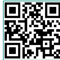
Video 3 Abwesenheitsmel- dung erstellen