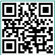
Video 1 Registrierung

Video 3: Abwesenheitsmeldung erstellen https://youtu.be/Ig-eSoJWXKg